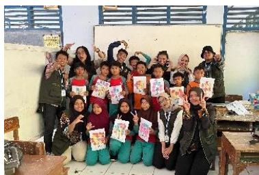
d. Pembuatan Wish Tree di SD N 3 Bodas pada Tanggal 1 Agustus 2025