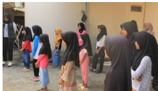
b. Pelaksanaan Senam Bersama Remaja Dusun Sigeblog