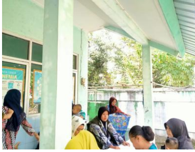
a. Pelaksanaan Pendampingan ILP Posyandu Balita dan Ibu Hamil Dusun Bodas