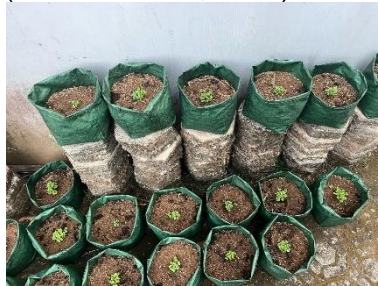
Gambar 3. Pelaksanaan Program Kerja Pembuatan Planter bag dan Penanaman Pakcoy

dipindahkan dengan mudah dan ramah lingkungan. Jenis wadah ini cocok sebagai pilihan berbudidaya di pekarangan rumah, karena harganya murah, lokasinya dapat disesuaikan, dan bisa digunakan berulang kali. Irigasi tetes merupakan metode penyiraman tanaman yang paling efektif dan efisien dalam budidaya. Volume air yang diberikan dapat disesuaikan dengan kebutuhan harian tanaman, sehingga mengurangi kehilangan air oleh penguapan atau mengalir tanpa diserap oleh tanaman. Selain itu, penggunaan sistem irigasi tetes juga dapat mengurangi penggunaan tenaga kerja karena dilakukan secara otomatis, sehingga biaya produksi berkurang signifikan (Murianto et al., 2024).