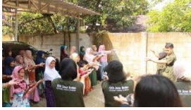
a. Pelaksanaan Senam Bersama Lansia Dusun Sigeblog