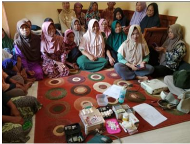
c. Pelaksanaan Pendampingan ILP Posyandu Lansia Dusun Sigeblog