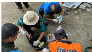
Gambar 4. Pelaksanaan Program Kerja Pembuatan Pupuk Organik Cair dari Limbah Buah Busuk

Kegiatan selanjutnya berupa sosialisasi dan pembuatan Pupuk Organik Cair (POC), yaitu pemberian materi terkait manfaat dan tata cara pembuatan POC yang berbahan dasar buah busuk. Tujuan utama diadakannya program ini adalah untuk mengelola sampah organik menjadi produk yang bermanfaat. Bahan yang digunakan dalam pembuatan POC ini meliputi air perasan buah busuk, larutan gula, dan air kelapa tua/muda. Air perasan dari buah busuk mengandung mikrobakteri yang baik untuk menunjang pertumbuhan tanaman maupun penguraian bahan organik lain dalam tanah. Semua bahan dicampurkan menjadi satu dengan perbandingan 1:1 dalam wadah tertutup untuk dilakukan fermentasi selama 7 hari. Menurut Asriyani et al. (2022), lamanya waktu dalam fermentasi dapat memengaruhi kandungan NPK dalam pupuk, semakin lama maka semakin meningkat. Setelah itu pupuk organik cair dapat diaplikasikan pada tanaman dengan pengenceran dengan air cucian beras atau air biasa dengan perbandingan 1:10.