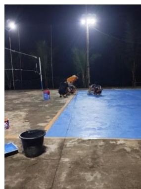
c. Pelaksanaan Kerja Bakti Pengecatan Lapangan Volly