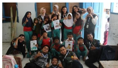
b. Pelaksanaan Pembuatan Kolase Foto dari Limbah Plastik di SDN 03 Bodas pada Tanggal 29 Juli 2025