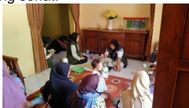
Gambar 7. Pelaksanaan Program Kerja DIMAS “Dapur Inovatif Makanan Sehat”

Permasalahan gizi kurang pada balita di Desa Bodas menjadi perhatian utama dalam bidang kesehatan, sehingga diperlukan upaya untuk memenuhi kebutuhan gizi anak secara optimal. Strategi untuk mengatasi masalah tersebut adalah kegiatan DIMAS “Dapur Inovatif Makanan Sehat”, merupakan program demonstrasi dan pembagian PMT. Program ini bertujuan untuk memenuhi kebutuhan gizi balita secara optimal serta mendukung pertumbuhan dan perkembangan anak melalui pembuatan puding jaka yang berbahan dasar dari jagung dan kacang hijau yang merupakan bahan pangan lokal khas Desa Bodas. Distribusi PMT dilakukan dengan metode home visit ke rumah ibu balita, guna meningkatkan kesadaran dan praktek pemberian makanan bergizi melalui interaksi personal di keluarga. Selain itu, pemberian buku saku PMT yang berisi daftar bahan makanan penukar (DBMP) dan resep PMT lokal kepada ibu-ibu balita menjadi media edukasi untuk memperkuat pemahaman dalam menyusun makanan yang sehat.