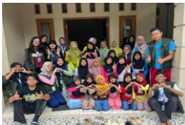
a. Pelaksanaan Pendampingan ILP Posyandu Remaja Dusun Sigeblog

Program kerja dengan sasaran remaja bertema kesehatan reproduksi yaitu PEDULI (Pendidikan Reproduksi untuk Remaja Peduli Diri) memiliki tujuan meningkatkan kesadaran terkait bahayanya pernikahan dan kehamilan dini. Angka kehamilan dan pernikahan dini di Desa Bodas masih sangat tinggi dengan mayoritas tingkat pendidikan SD. Hal tersebut dapat menjadi faktor risiko berbagai permasalahan reproduksi hingga permasalahan pertumbuhan dan perkembangan generasi berikutnya. Kegiatan PEDULI diikuti oleh 18 remaja Dusun Sigeblog. Program PEDULI meliputi kegiatan senam, edukasi kesehatan reproduksi, mini kuis, cek kesehatan yaitu gula darah dan tekanan darah.