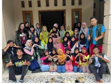
b. Pelaksanaan Pendampingan ILP Posyandu Remaja Dusun Sigeblog