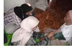
c. Pelaksanaan Home Visit Pengukuran Tekanan Darah pada Individu dengan Tekanan Darah Diatolik >200 mmHg