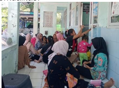
Gambar a. Pelaksanaan Sosialisasi GEMASTIGI “Gerakan Masyarakat Sadar Tingkatkan Gizi” Di Dusun Bodas

sehingga kedepannya generasi muda dapat tumbuh dengan optimal dan berkualitas.