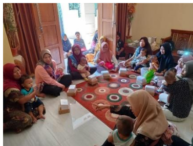
Gambar b. Pelaksanaan Sosialisasi GEMASTIGI “Gerakan Masyarakat Sadar Tingkatkan Gizi” Di Dusun Sigeblog