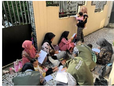
d. Pelaksanaan Pendampingan ILP Posyandu Balita dan Ibu Hamil Dusun Sigeblog