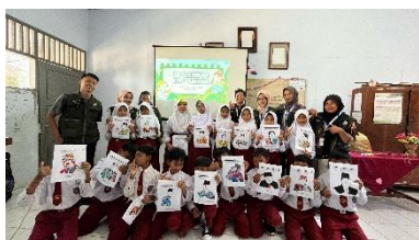
a. Pelaksanaan Pembuatan Kolase Foto dari Limbah Plastik di SDN 01 Bodas pada Tanggal 15 Juli 2025

edukasi yang kreatif, mengajak masyarakat untuk berpartisipasi aktif dalam pengelolaan sampah dan menciptakan karya seni yang bermakna (Destiana Lahabu et al., 2024). Kegiatan sosialisasi kebersihan lingkungan di sekolah dasar bertujuan untuk membentuk kesadaran peserta didik sejak dini terhadap pentingnya menjaga kebersihan sebagai fondasi kesejahteraan bersama, serta akan berdampak positif pada perkembangan karakter dan perilaku peduli lingkungan untuk peserta didik. Sedangkan, kegiatan pembuatan kolase foto dari limbah plastik menjadi inovasi kreatif yang memadukan edukasi lingkungan dengan seni. Melalui aktivitas ini, peserta didik diberikan kesempatan untuk memanfaatkan limbah plastik sebagai bahan utama dalam berkarya visual, memperkuat kreativitas sekaligus memahami nilai daur ulang.