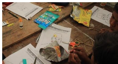
d. Pelaksanaan Pembuatan Kolase Foto dari Limbah Plastik di SDN 02 Bodas pada Tanggal 1 Agustus 2025