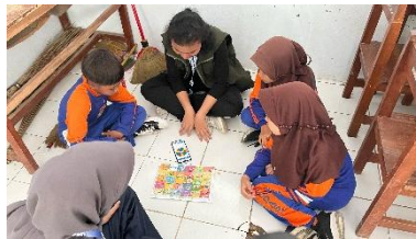
Gambar 10. Pelaksanaan Program Kerja GESIT “Gerakan Sehat Lewat Edukasi PHBS Interaktif dengan Ular Tangga”

Permasalahan hygiene sanitasi yang terbatas di Desa Bodas, khususnya minimnya ketersediaan air bersih untuk aktivitas sehari-hari dan perilaku BAB di sungai yang dapat menimbulkan risiko tinggi terhadap kesehatan masyarakat, terutama penyakit diare dan infeksi lainnya. Program GESIT “Gerakan Sehat Lewat Edukasi PHBS Interaktif dengan Ular Tangga” dikembangkan untuk mengedukasi anak-anak sekolah dasar tentang pentingnya sanitasi layak dan praktik PHBS yang tepat. Melalui edukasi dan permainan ular tangga interaktif, anak-anak diberikan pesan edukatif mengenai pentingnya berbagai aspek penting dalam PHBS, terutama praktik mencuci tangan yang benar dan pemilahan sampah sesuai jenisnya. Setiap langkah dalam permainan ular tangga ini disisipkan pesan edukatif mengenai kebersihan seperti mencuci tangan dengan sabun sebelum makan, menjaga kebersihan diri, dan mengonsumsi makanan yang sehat. Dengan adanya kegiatan GESIT, diharapkan generasi muda sejak dini dapat memiliki kesadaran pola hidup bersih dan sehat sebagai dasar untuk mencegah penyakit dan meningkatkan kualitas hidup di masa depan.