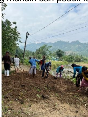
a. Pelaksanaan Kerja Bakti Membersihkan Lingkungan Dusun Bodas

Lingkungan yang kurang terawat di Desa Bodas dapat menimbulkan risiko gangguan kesehatan bagi warga, sehingga diperlukan langkah bersama untuk menciptakan lingkungan yang bersih dan terawat. Oleh karena itu, kegiatan BERSERI “Bersih, Sehat, dan Rapi di Hari Minggu untuk Desa Mandiri” berupa gotong royong rutin yang melibatkan seluruh masyarakat dan mahasiswa KKN. Kegiatan ini berfokus pada pembersihan jalan, jembatan, lapangan, dan area umum lainnya dengan tujuan meningkatkan kualitas hidup. Selain dari manfaat kesehatan lingkungan, kegiatan ini juga mempererat solidaritas dan hubungan sosial antar warga, sehingga tercipta Desa Bodas yang mandiri dan peduli terhadap kebersihan.