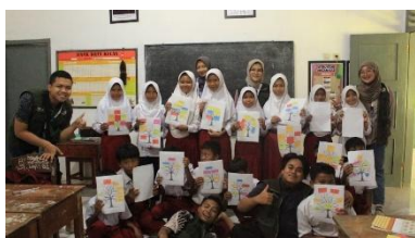
a. Pembuatan Wish Tree di MI Nurul Ulum Bodas pada Tanggal 28 Juli 2025

Pembuatan wish tree dilaksanakan sebagai media kreatif untuk memfasilitasi peserta didik dalam mengekspresikan cita-cita dan harapan mereka. Melalui kegiatan ini, peserta didik didorong untuk menetapkan tujuan belajar yang jelas, menumbuhkan sikap optimis, dan memelihara motivasi dalam mencapai impian. Selain menjadi sarana refleksi pribadi, wish tree juga diharapkan dapat menciptakan suasana belajar yang positif, interaktif, dan inspiratif, sehingga mendorong peserta didik untuk saling memberikan dukungan dan motivasi. Kombinasi antara sosialisasi motivasi belajar dan pembuatan wish tree diharapkan mampu membentuk lingkungan belajar yang kondusif, produktif, dan berorientasi pada pencapaian tujuan akademik maupun pengembangan karakter siswa.