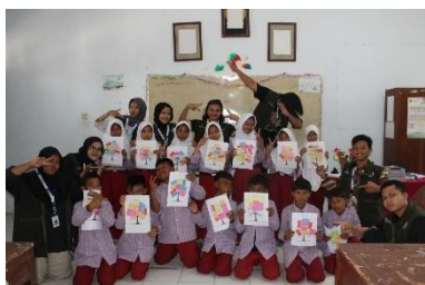
c. Pembuatan Wish Tree di SD N 1 Bodas pada Tanggal 30 Juli 2025