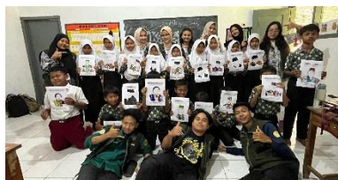
c. Pelaksanaan Pembuatan Kolase Foto dari Limbah Plastik di MI Nurul Ulum Bodas pada Tanggal 17 Juli 2025