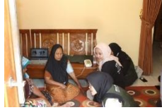
b. Pelaksanaan Pengukuran Tekanan Darah di ILP Posyandu Lansia Dusun Sigeblog