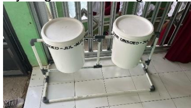
Gambar 5. Pelaksanaan Program Kerja Pembuatan Pupuk Organik Cair dari Limbah Buah Busuk

Sampah merupakan permasalahan yang masih menjadi momok menakutkan di negara ini. Kurangnya kesadaran masyarakat terhadap pengelolaan sampah, membuat sampah-sampah tersebut menumpuk dan berserakan sehingga mengganggu kebersihan lingkungan. Kondisi lingkungan yang tercemar sampah berdampak negatif pada kenyamanan hingga kesehatan masyarakat sehingga sangat merugikan (Nggilu et al., 2022). Oleh karena itu, program perakitan tempat sampah menjadi krusial untuk diterapkan di desa pada saat pelaksanaan KKN. Tempat sampah yang digunakan berbahan plastik yang tidak mudah rusak dan tahan lama. Tujuan dari pemberian tempat sampah ini adalah untuk meningkatkan kesadaran masyarakat seminimalnya agar membuang sampah pada tempatnya.