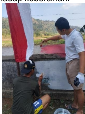
b. Pelaksanaan Kerja Bakti Pengecatan Jembatan