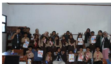
b. Pembuatan Wish Tree di SD N 2 Bodas pada Tanggal 29 Juli 2025