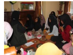
c. Pelaksanaan Sosialisasi PEDULI "Pendidikan Reproduksi untuk Remaja Peduli Diri"